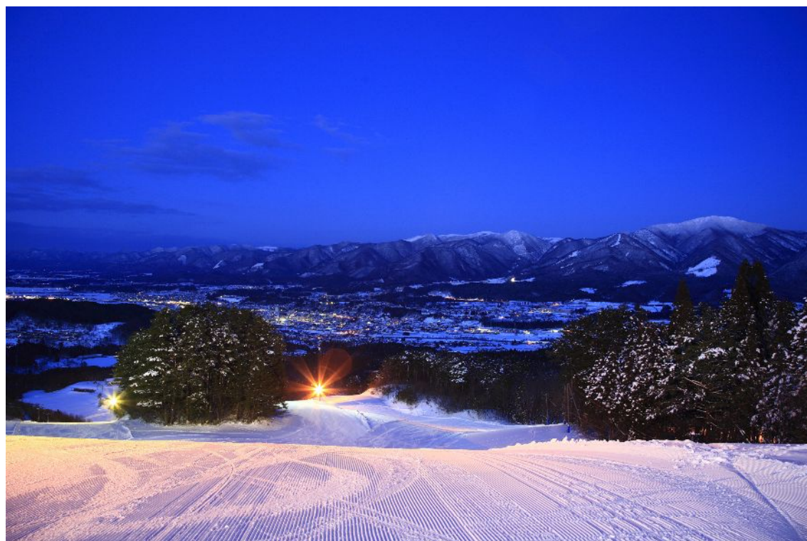
(山頂より鹿角市街地の夜景)