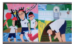
草木の四季制作中！

今年度も、全校で秋田県立美術館に行ってきました。「秋田の行事」を再度鑑賞して刺激を受けた子どもたちは、「草木の夏」の制作に取りかかり始めました。「草木の春」は現在体育館入り口に展示中) 低学年児童は同日大森山動物園を訪れ、動物のスケッチに挑戦しました。更に、高学年の子どもたちは、今月「根曲がり竹細工」に挑戦し始めました。これらの活動を通して「主体性」を育てたいです。