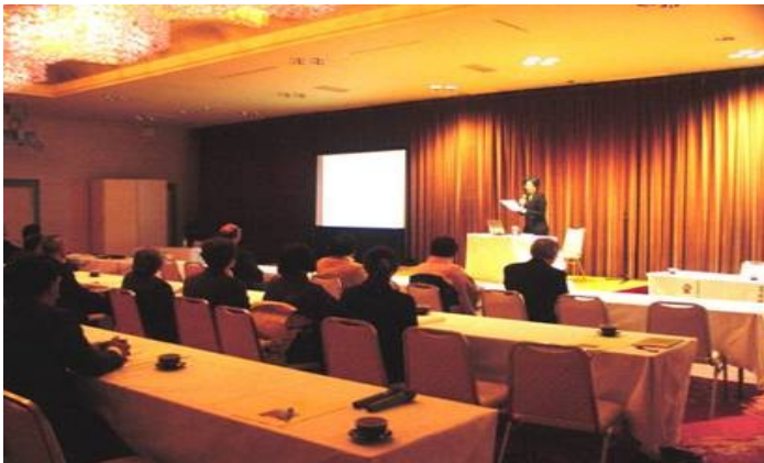
12/19 帰国報告会 並びに 懇談会を開催しました。