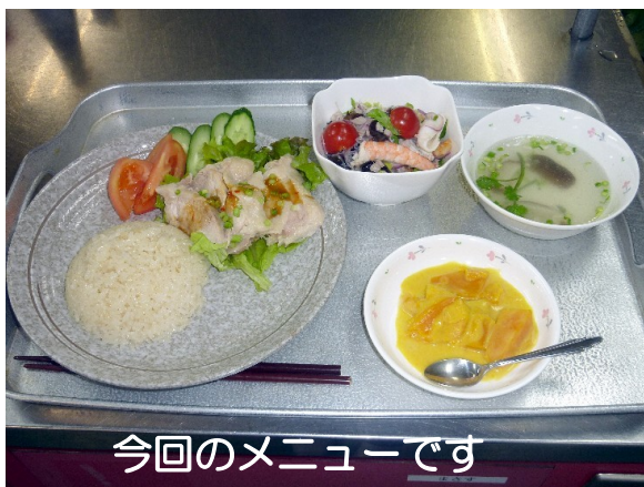
今回のメニューです

参加者は16名。日本では見慣れないスパイスにも『美味しいわ！どこで買えるの？』と大好評でした。