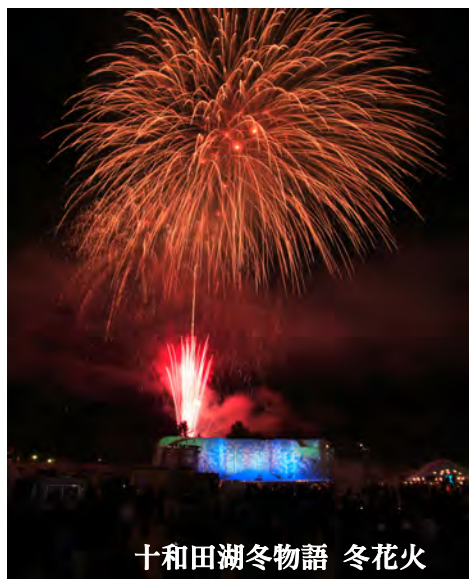
十和田湖冬物語 冬花火