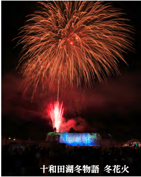
十和田湖冬物語 冬花火