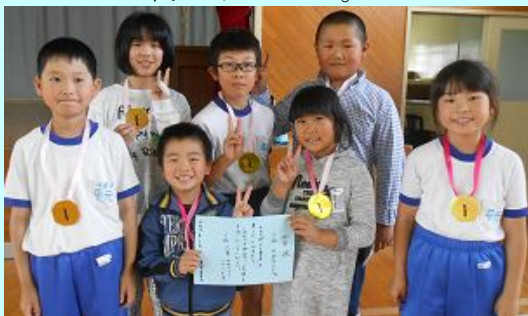
賞状をもらった三班

最後は、上位3チームに対し、運営委員から手作りのメダルと賞状が授与されました。感想発表では、「1位になれなくともみんなで協力してよかった」「とても楽しかった」などの声が聞かれました。進んで全校児童の前に出て堂々と発表する姿は、大変立派でした。自分たちで集会をつくりあげる力が付いたり、楽しくふれ合えたりしたことが何よりでした。