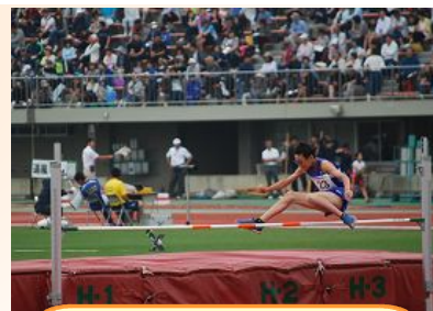
自己記録を更新、見事8位入賞