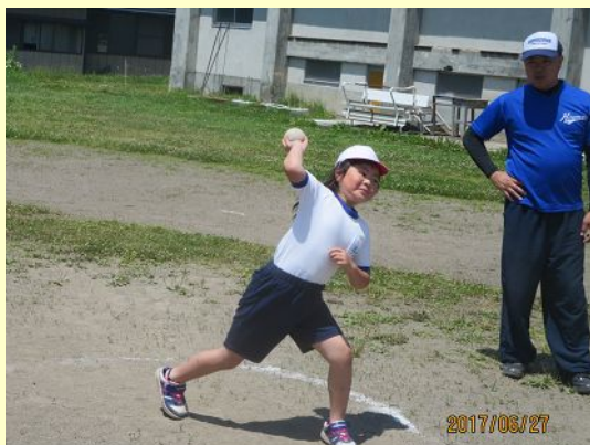
ダイナミックな投球 フォームになった2年生

なお、本校の体力は全国平均とほぼ同様の傾向を示していますが、近年は「長座体前屈」が課題となっています。「筋肉の過度な緊張を取り除くため日常の姿勢をよくする」「風呂上がりのストレッチ（柔軟）」への継続的な取組が有効のようです。けが防止にもつながりますので、ご家庭でも意識していただければ幸いです。