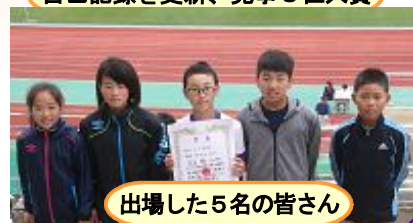
出場した5名の皆さん