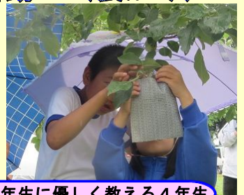
傘を差し、1年生に優しく教える4年生