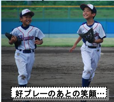
好プレーのあとの笑顔...

6年生にとっては、次が最後の公式戦(7月22、23 J A 野球大会)となります。