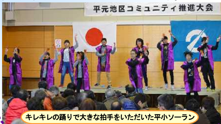
キラキラの踊りで大きな拍手をいただいた平小ソーラン

盛大な拍手をいただき、地域の方々にたくさんの元気を届けることができたと思われます。