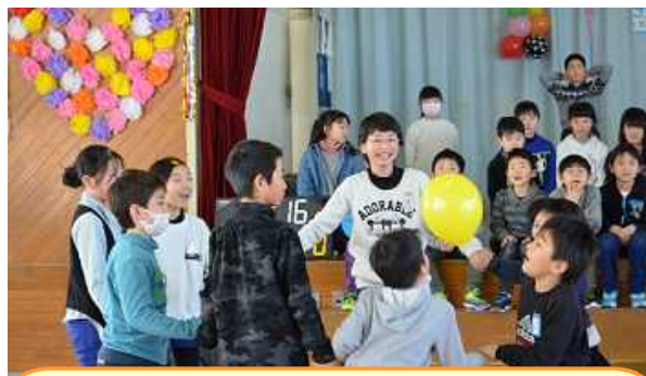
6年生を送る会で盛り上がった「風船落とすなゲーム」

下級生を優しく見守る6年生の眼差しには、既に中学生の風格が感じられました。下級生からも大好きな6年生のため、精一杯頑張ろうとする気持ちが伝わってきて、とても温かい会となりました。卒業、進級に向け、子どもたちの大きな成長ぶりも感じられました。特に、最上級生を見据えた5年生の活躍が光りました。