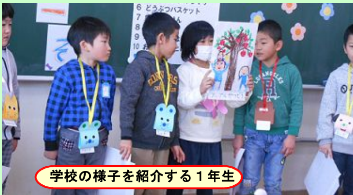
学校の様子を紹介する1年生

準備を頑張り、交流会を進めた1年生は、すっかりお兄さん・お姉さんらしくなり、こちらも満足そうな笑顔がいっぱいでした。