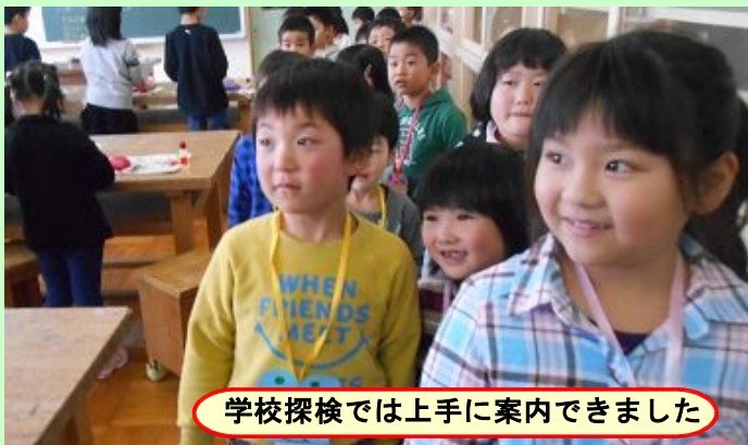
学校探検では上手に案内できました