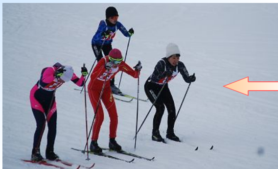
女子リレーでの見事なスタートダッシュ

個人では残念ながら入賞することはできませんでしたが、どの選手も自己記録を更新することができました。そして女子リレーは最後の競り合いを制して6位入賞を果たし、賞状をいただくことができました。親の会の皆様には、大荒れの天候の中でのテント設営とワックス作業、そして応援や撤収作業と大変ご難儀をおかけしました。ご協力に感謝申し上げます。ありがとうございました。