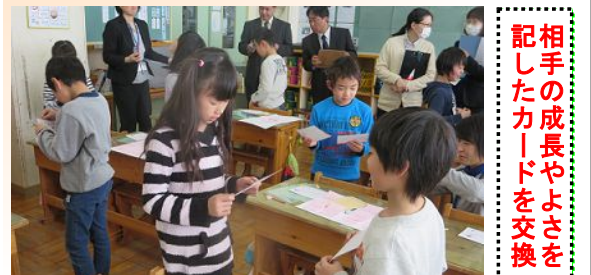
相手の成長やよさを記したカードを交換

1月31日に2年生が「自分や友だちのよさや成長したところを伝え合おう」という生活科の学習を行い、全校の先生方が参観しました。友達が事前にかけてくれた「ありがとうカード」や「すごいねカード」を手渡され、どの子どもも少し照れながらも、この1年間での自分の成長ぶりやがんばりを感じ取っていました。周囲への感謝の気持ちにもしっかりと気付いており、大変立派でした。