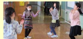
低学年はダンスを披露？