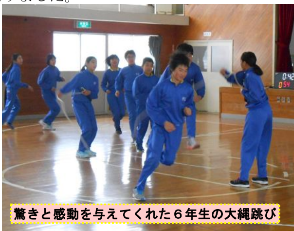
驚きと感動を与えてくれた6年生の大縄跳び

体を鍛えることはもちろん、目的に向かってチャレンジする楽しさ、粘り強く取り組み達成できた時の喜び、仲間に認められる有用感など、たくさんの心の成長を感じさせてくれた集会となりました。