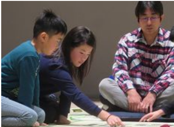
写真は、2年生と5年生ペア

子どもたちは、冬休み中も地域の皆様に見守られ、育まれ、様々な体験を通してより大きく成長したようです。ありがとうございました。