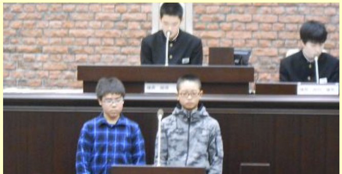
「平元小の実践が参考になった」という意見をいただきました

会議の最後には、出席者全員でいじめ防止宣言を行い、鹿角市全体で「明るくいじめのない学校」を目指すことを誓い合いました。