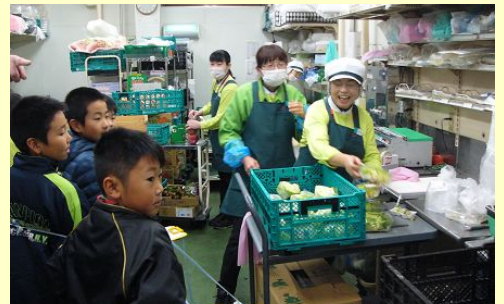
3年生 ショッピングセンターの見学

どちらの見学も、22日に実施されました。共通していたのは、通常では見ることができない特別な場所を見学させていただいたことです。図書館では100年以上前の本や新聞を保管している部屋を、鹿角SCでは野菜や肉を切る場面を見学させていただきました。貴重な体験となり、子どもたちは多くのことを学びました。