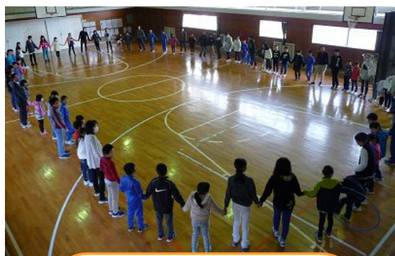
全校フラフープくぐりゲームの様子