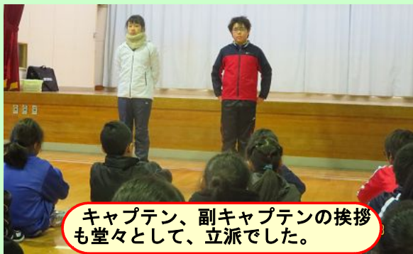
キャプテン、副キャプテンの挨拶も堂々として、立派でした。