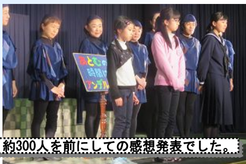
約300人を前にしての感想発表でした。

なお、感想発表では学校代表児童が大勢の前でしっかりと自分の考えを述べることができました。