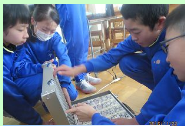
ジュラルミンケースで1億円

22日に鹿角市市民部 税務課の2名の方々を講師に招き、税の種類や大切さなどを学びました。