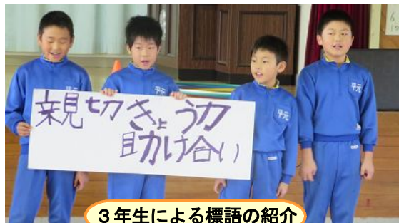
3年生による標語の紹介

なお、1月11日の10時から鹿角市役所の本会議場（予定）で「鹿角市いじめ防止子ども会議」が開催されますが、本校代表児童も取組の様子を発表する予定です。【会議は公開…保護者の参観も可能】