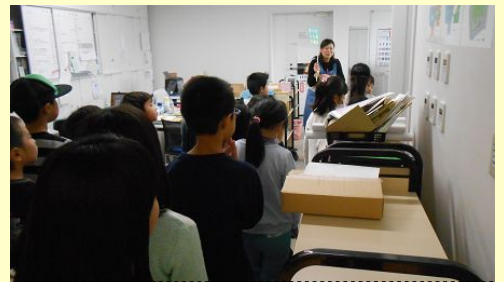
2年生まち探検…花輪図書館の見学