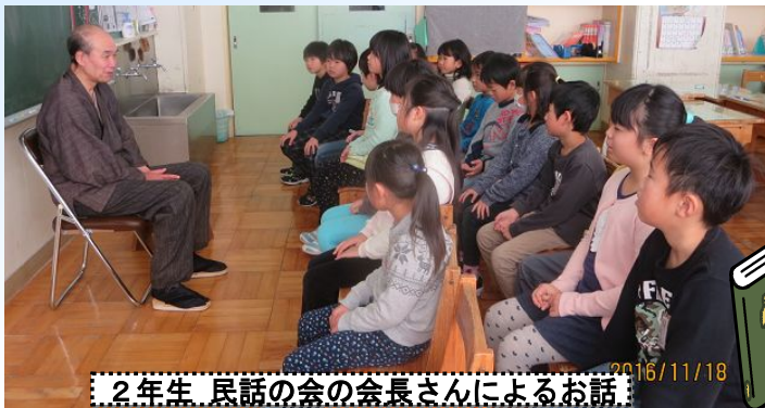
2年生 民話の会の会長さんによるお話