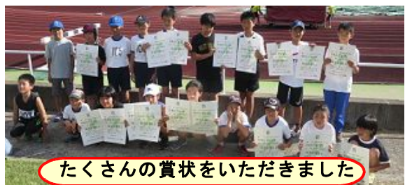
たくさんの賞状をいただきました