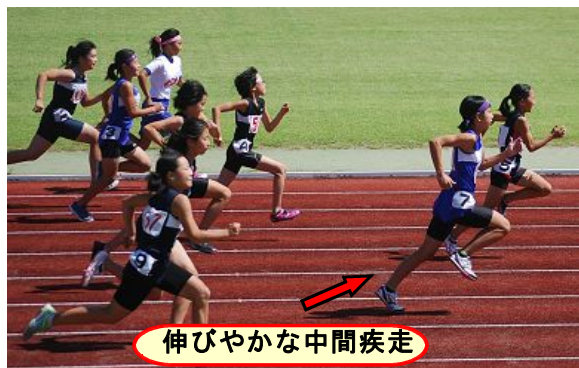
伸びやかな中間疾走