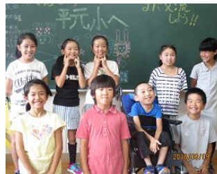
9/9 4年 今年もなかよく交流