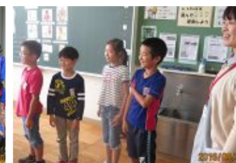
9/16 3年 給食センター栄養士の先生の食育