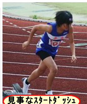
見事なスタートダッシュ