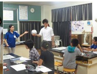
9/9 6年 二中の先生と理科の学習