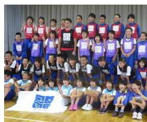
9/13 5年「夢の教室」(北小と合同)