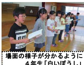
場面の様子が分かるように4年生「白いぼうし」