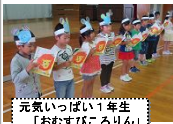
元気いっぱい1年生「おむすびころりん」

7月14日、学校や家での音読練習の成果を発表し合う音読発表会を行いました。声の大きさや口形、速さや間の取り方等に気を付けながら読みました。動作を入れたり、役割読みをしたりと、各学年とも情景が伝わるように工夫を凝らしており、聞く側も真剣に耳を傾けていました。最後は多くの子どもが進んで感想を発表しました。音読は脳を活性化させ、思考力や想像力を高める点でも有効です。継続して取り組むよう、ご家庭での励ましをお願いします。