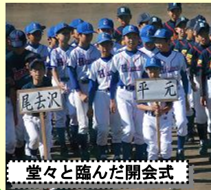
堂々と臨んだ開会式

保護者の皆様、地域の皆様、ご声援ありがとうございました。 決勝戦は小坂小対尾去沢小、優勝は小坂小