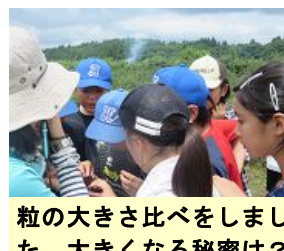
粒の大きさ比べをしました。大きくなる秘密は?