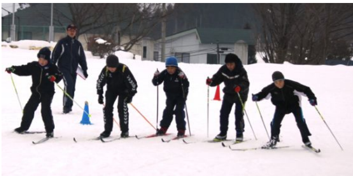
男女・学年混合の5チーム対抗リレー