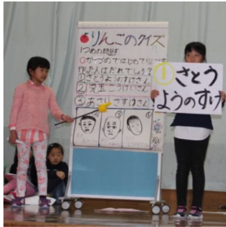
3年生はクイズを交えて発表