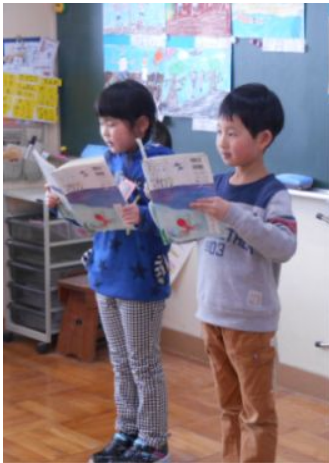
音読を発表する1年生

「かがやき集会」では、各学年でテーマを設定し、1年間を通して調べたり体験したりしたことを発表しました。特に今年度は、創立140周年を迎えたことも意識し、平元地区の良さを発信することをねらいとして学習を進めてきました。また、初めての試みとして、6年生はワールドカフェ方式の発表を行いました。どの学年も自分たちなりに考えたことや、平元に対する思いや願いを大勢の皆さんの前で堂々と発表することができました。