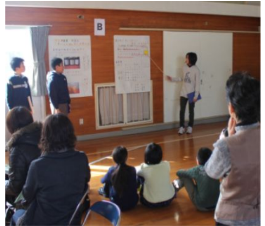
6年生は4箇所に分かれて発表