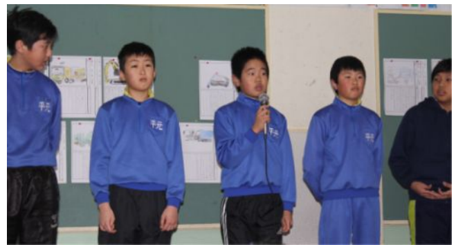
卒団する6年生のスピーチ