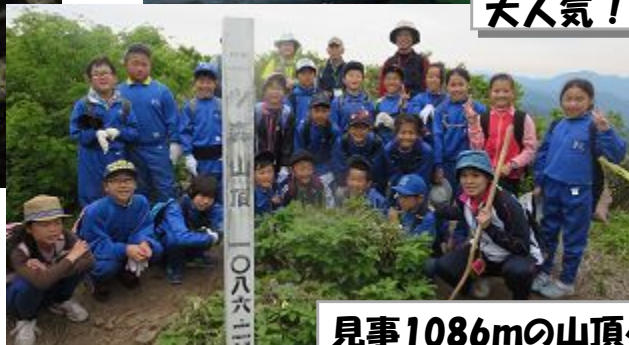
見事1086mの山頂へ!ニツ森