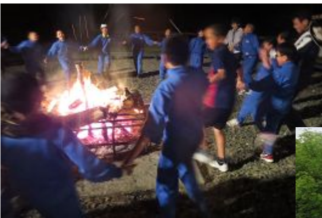
盛り上がったキャンプファイヤー