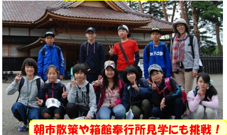
朝市散策や箱館奉行所見学にも挑戦!