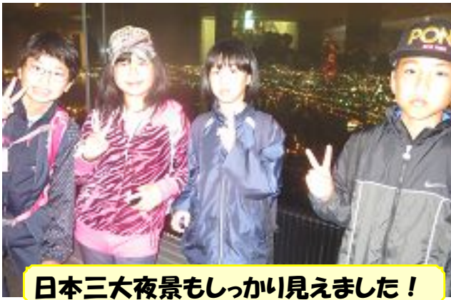
日本三大夜景もしっかり見えました!