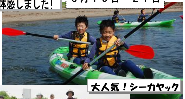
大人気!シーカヤック