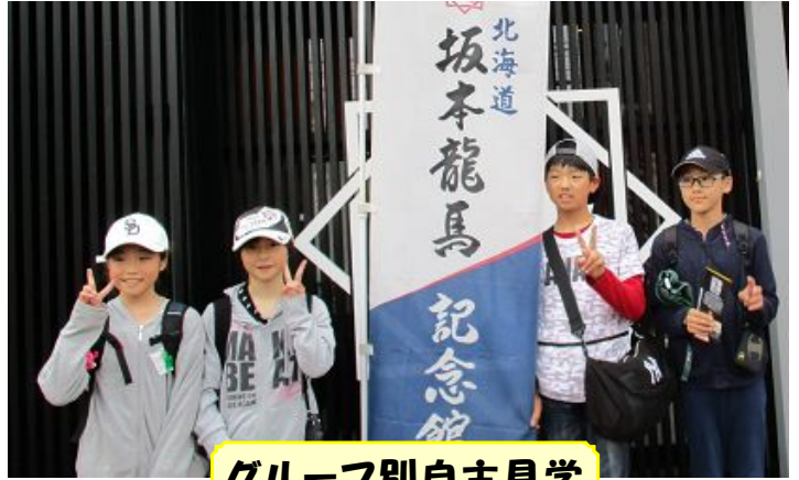
グループ別自主見学