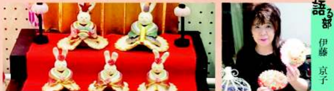
話る部 伊藤 京子

開催日 ご希望の日(応相談)を選んでご予約ください ①お雛様3回コース ¥4,950- (共に材料費込み) ②小物等2回コース ¥3,300-