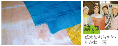
講師 草木染むらさき・あかね工房

7月は秋田路を使った風の色、8月はヨシを使った花輪ばやしの光の色、9月は藍の生葉を使った空の色、鹿角色をシルクにのせてストールを染めます。